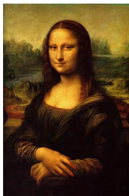
La Joconde ou Portrait de Mona Lisa (v.1503/1506) de Léonard de Vinci (1452-1519, italien)

Qu'est-ce que la perspective ? C'est l'ensemble des règles/techniques permettant de représenter la 3D (3 dimensions : hauteur, largeur et profondeur) sur un support en 2D (2 dimensions : hauteur et largeur). C'est à partir de la Renaissance (XV ème siècle) que la perspective apparaît et se développe.