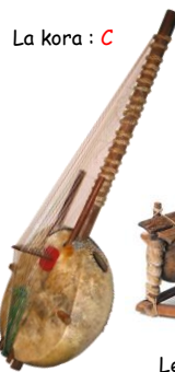
La kora : C