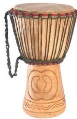
Le djembe : M