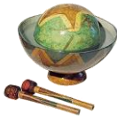
Le tambour d'eau : I