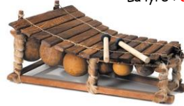
Le balafon : I