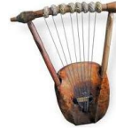
La lyre : C