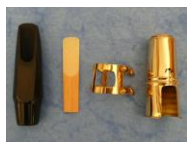
Anche simple ou Anche double